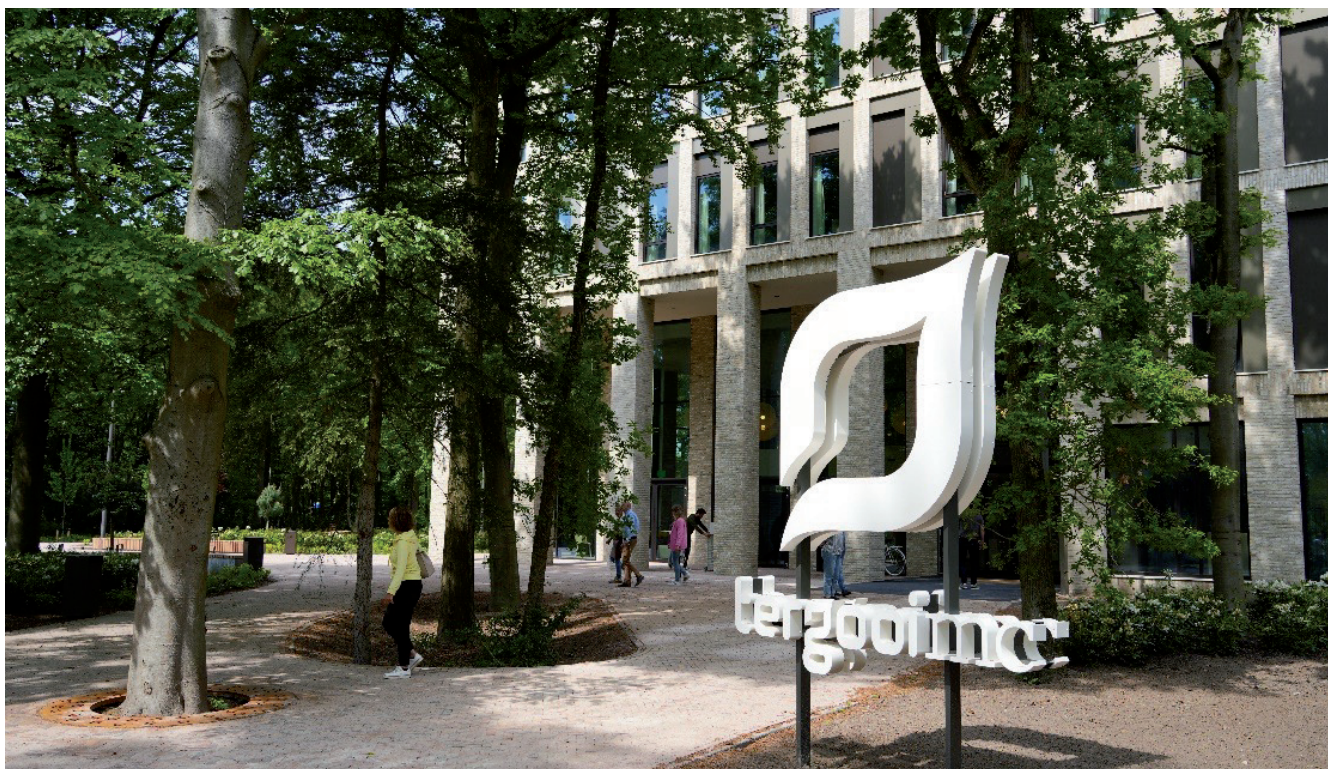
Nieuwbouw Tergooi MC